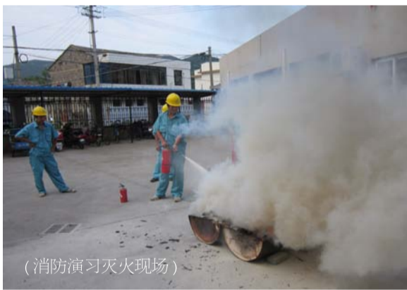
(消防演习灭火现场)

为进一步加强营业所消防安全管理，预防火灾发生，提高员工的安全防火意识及基本技能，8月12日下午岑湾营业所在厂区内组织职工举行了夏季消防安全演习。