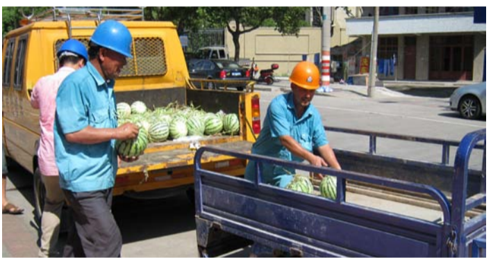
【定海营业所看望慰问高温下的安装工人】

另悉，随着高温的持续发酵，昌通公司、定海营业所、岱山分公司、普陀山水厂还各自带着矿泉水、绿豆汤等饮品及正汽水、人丹、救心丸等防暑降温应急药品，多次赴施工现场慰问一线职工。(贺争杰、夏晓红、戎芬)