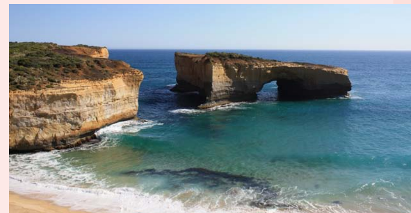
伦敦桥 供水技术部 郑德敏摄 三等奖