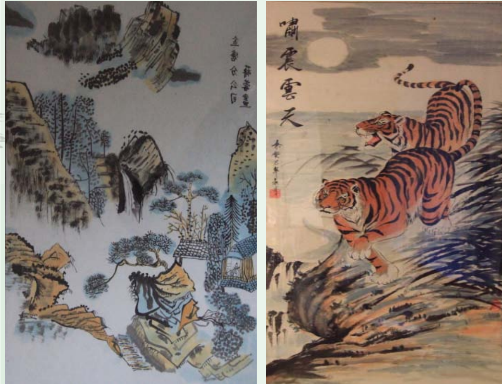
一等奖 蒋 蓉