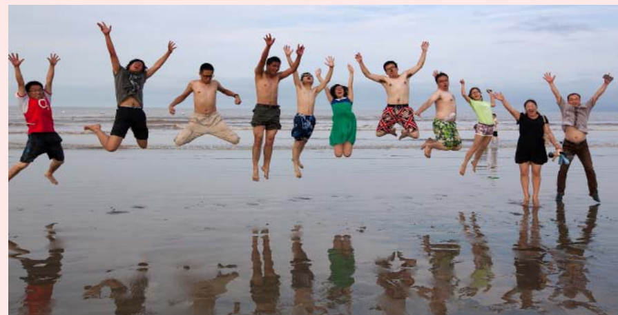
飞扬的青春 岑港营业所 徐其红摄 一等奖