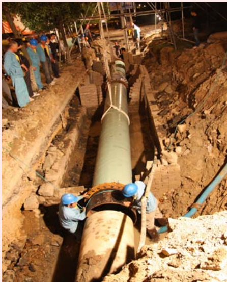
彻夜奋战定海营业所 二等奖