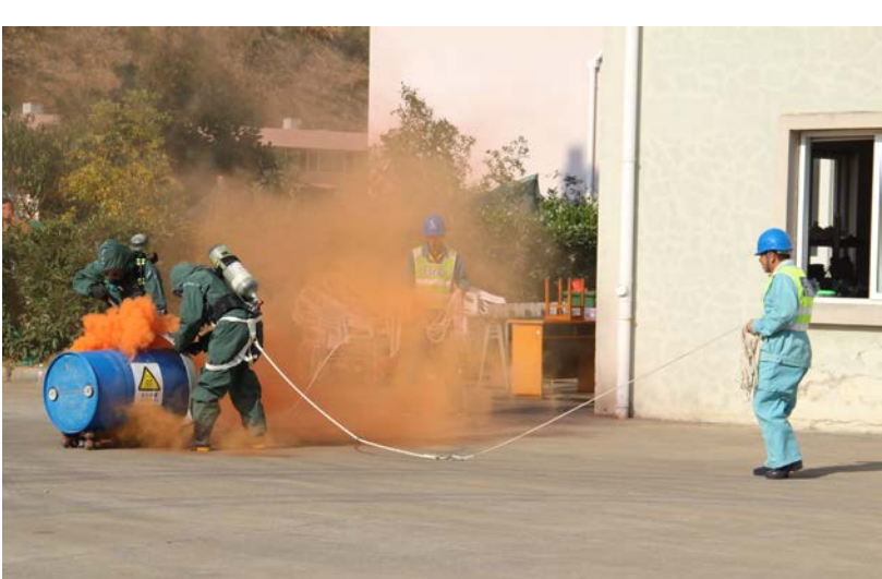
液氯模拟演习现场抢修

液氯主要用于自来水的杀菌、消毒，但同时它又是剧毒液体，一旦泄漏，不仅会造成供水安全，还会给人民群众的生命财产安全带来影响。那么液氯泄漏了该怎么办？