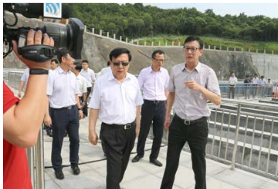
夏宝龙在定海水厂平流沉淀池前考察