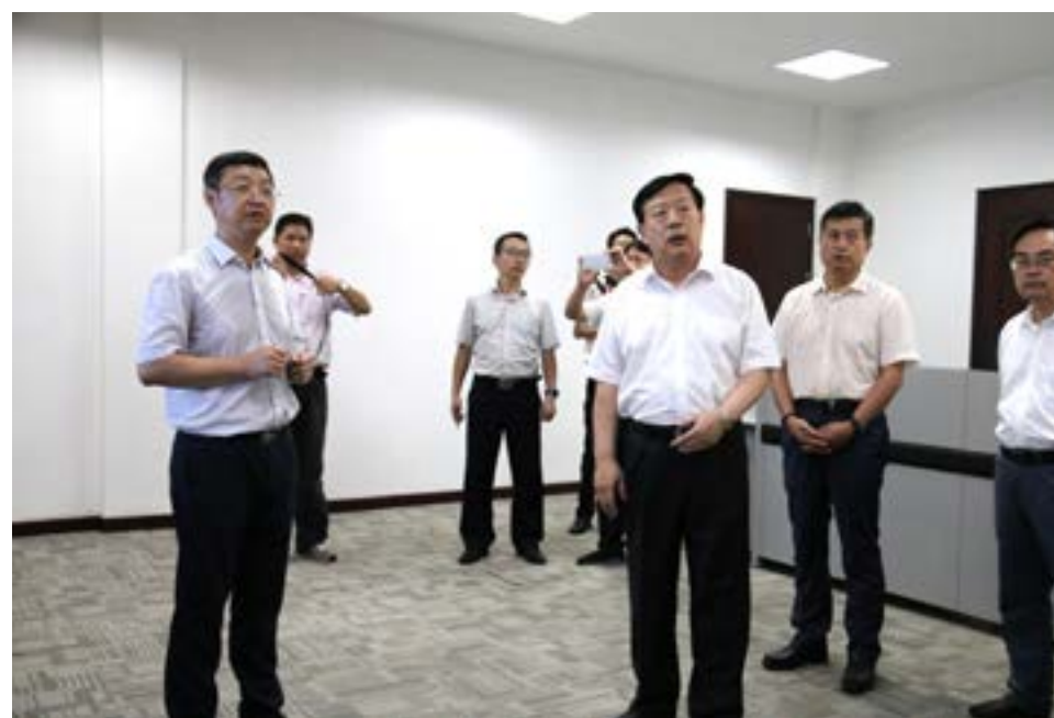
公司党委书记、总经理柴吕波向夏宝龙一行介绍水厂有关情况

8月9日下午，全国人大环境与资源保护委员会副主任委员夏宝龙率调研组一行到定海水厂考察。